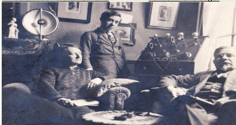
Zender + Ontvanger

Naast gloeilampen fabriceerde Philips ook radiolampen, later radio ontvangoestellen (hout/bakeliet).